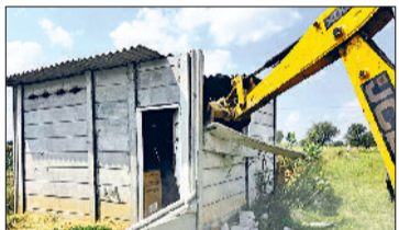
महेंद्रगढ़। अवैध निर्माण हटायी जेसीबी मशीन।