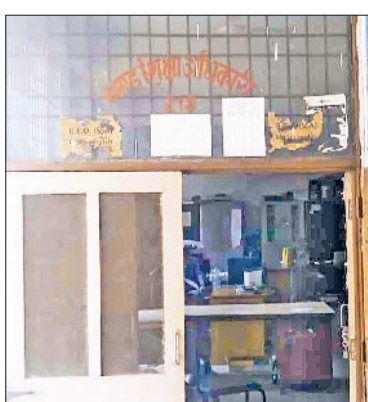
महेंद्रगढ़। खंड शिक्षा अधिकारी कार्यालय।

गौरतलब है कि अधिकतर सरकारी व गैर सरकारी स्कूलों के आसपास दुकानदार तंबाकू, गुटखा, बीड़ी, सिगरेट बेचते हैं, जिससे विद्यालय में पढ़ने वाले विद्यार्थी छोटी उम्र में ही तंबाकू, गुटखा खाले की लत लग जाती है। इसी को देखते हुए विद्यालय शिक्षा निदेशालय ने यह आदेश जारी किए हैं। इसके अलावा कई जगहों पर स्कूलों के परचन की दुकानों में सिगरेट, तंबाकू व बीड़ी की बिक्री होती है, इससे बच्चों पर