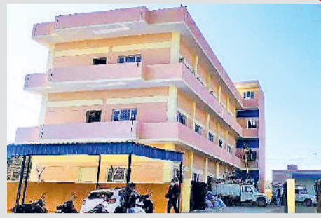
महेन्द्रगढ़। बिजली निगम कार्यालय।

जर्जर तारों के कारण शहरी इलाके में हमेशा हादसे होते रहते हैं। खासकर बरसात के मौसम में यह परेशानी ज्यादा उत्पन्न होती है। जिसको देखते हुए बिजली निगम ने जर्जर तारों के बदलने का काम शुरू किया है। जिस रफ्तार से कार्य हो रहा है। उससे लग रहा है कि निश्चित समय तक तार बदल दिए जाएंगे। इससे निगम को तो फायदा होगा ही, साथ ही साथ उपभोक्ताओं को भी सहूलियत होगी।