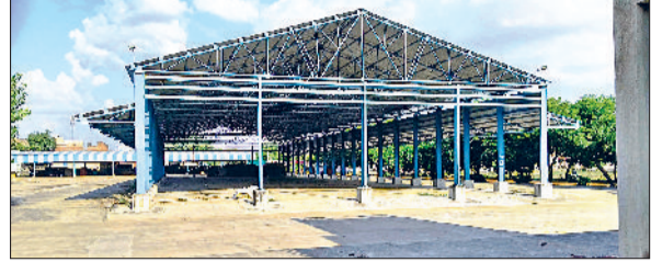
नांगल चौधरी। बाजरे की खरीद के लिए निर्धारित टोकन।

बता दें कि बीते महीने केंद्र सरकार ने रबी सीजन वाली फसलों के एमएसपी तय किए हैं। एक अक्टूबर से प्रदेश की सभी सरलैक्विड मंडियों में बाजरे की खरीद आरंभ करने के निर्देश जारी कर दिए हैं। साथ ही जिला उपायुक्त को मंडियों की विजिट करने तथा मूलभूत सुविधाओं का निरीक्षण करने के लिए अधिकृत किया गया