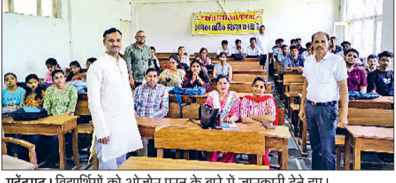
महेन्द्रगढ़। विद्यार्थियों को ओजोन परत के बारे में जानकारी देते हुए।